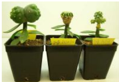
← Photo de jpp13 : Lophophora williamsii , Geohintonia mexicana et Sclerocactus pubispinus SB 1467

Le Geohintonia mexicana en quatre mois a multiplié sa taille par 10, passant de 2 mm à 2 cm (alors que les autres plantules restées sur racines n'étaient qu'à 3 mm)